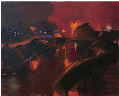
《夜の蟹江川》油彩 15F 2008年