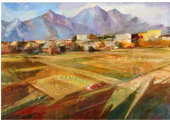
《鈴鹿山青雲望む》油彩 100P 2010年第86回白日会展出品作 アートもりもと賞を受賞