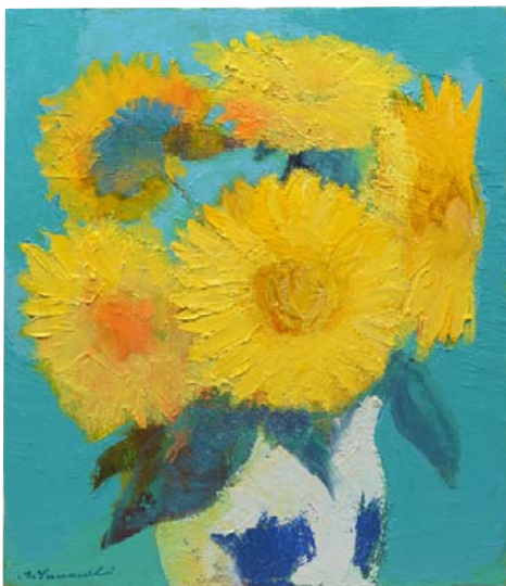
《ひまわり》油彩 10F 昭和会展の審査会で意見を分けた作品