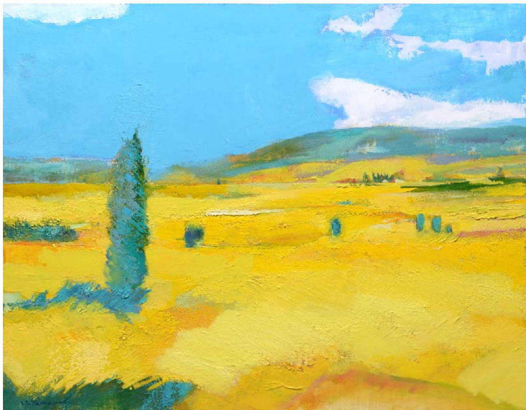
《陽が昇る日》油彩 50F 第48回昭和会展東京海上日動賞受賞作品 「パリから100キロ南の村エティニー・ヴェロンの風景です。本当に何も無い場所。だからこそ僕には感動の多い土地でした」