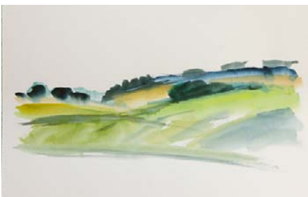
いずれも2010年に訪れたフランスでのスケッチ