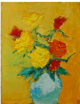
《パリ》油彩 6F 2012年