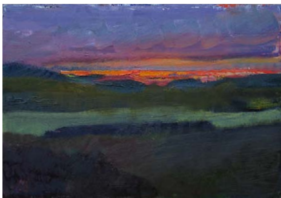
《エティニーの夕暮れ》油彩 20M 2011年